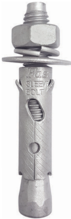
Hot Dip Galvanized

The perfect concrete anchoring solution designed for a quick and easy installation.